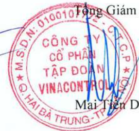
Mai Tiến Dũng

Các thuyết minh đính kèm là bộ phận hợp thành của báo cáo tài chính riêng giữa niên độ này