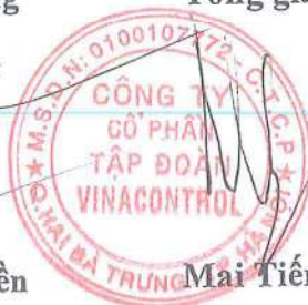
Mai Tiến Dũng