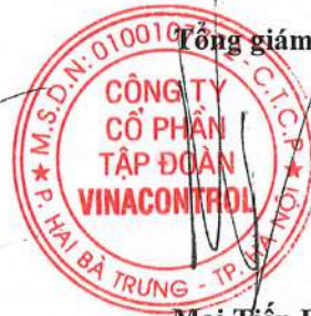
Mai Tiến Dũng