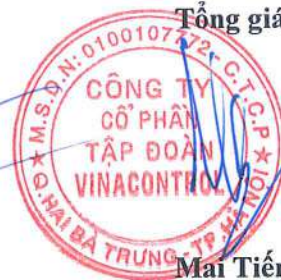
Mai Tiến Dũng