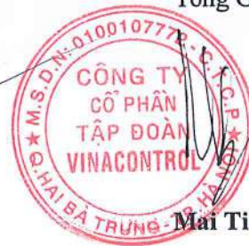
Mai Tiến Dũng