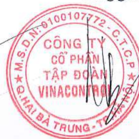
Mai Tiến Dũng