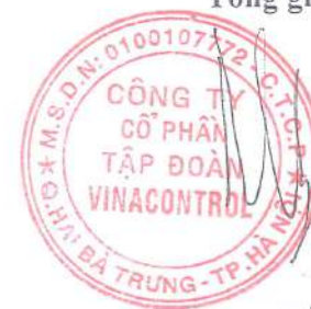
Mai Tiến Dũng