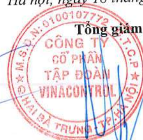
Mai Tiến Dũng