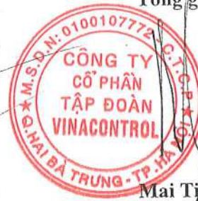
Mai Tiến Dũng