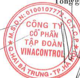
Mai Tiến Dũng