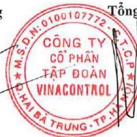
Mai Tiến Dũng