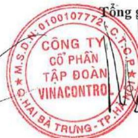
Mai Tiến Dũng