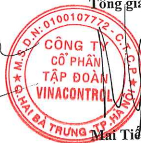
Mai Tiến Dũng